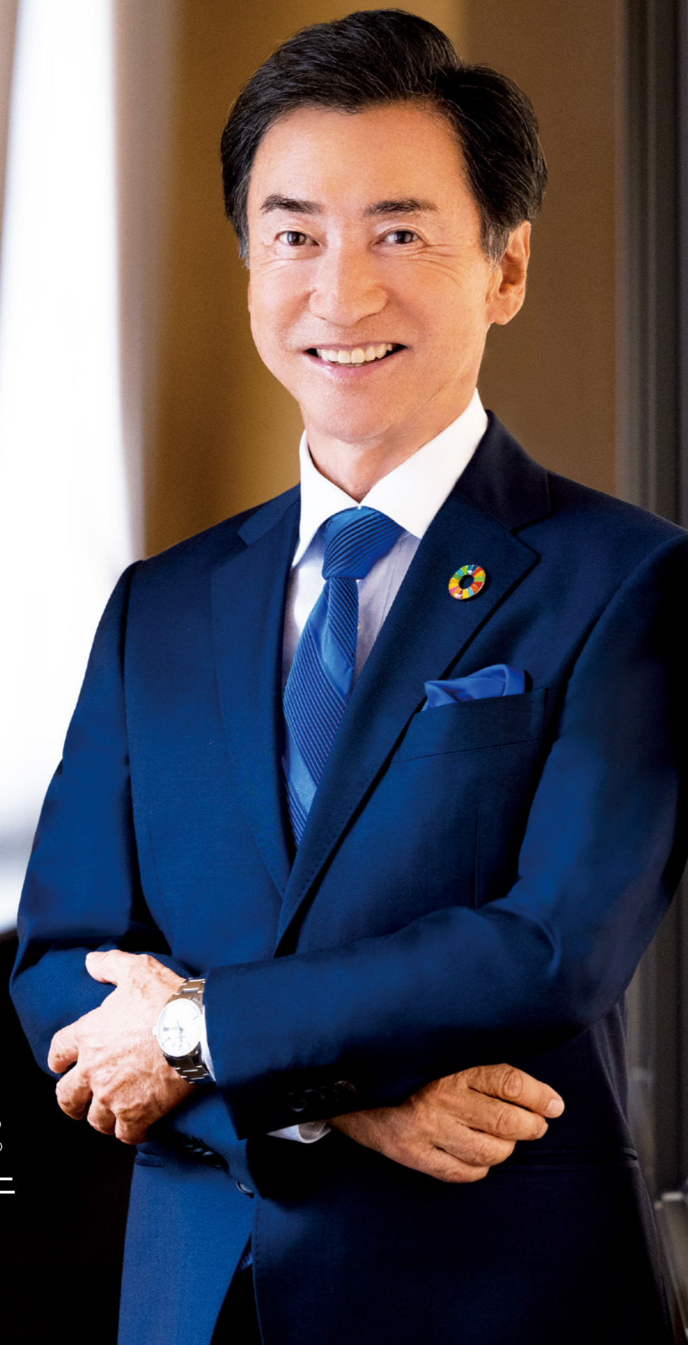
代表取締役会長 兼 グループCEO 兼 グループCCO